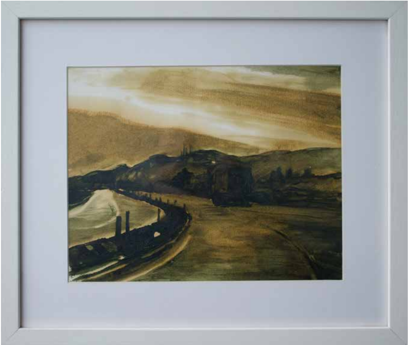
Hakan Özer, Kağıt üzerine yağlı boya / Oil on paper, 35x41cm, 2014