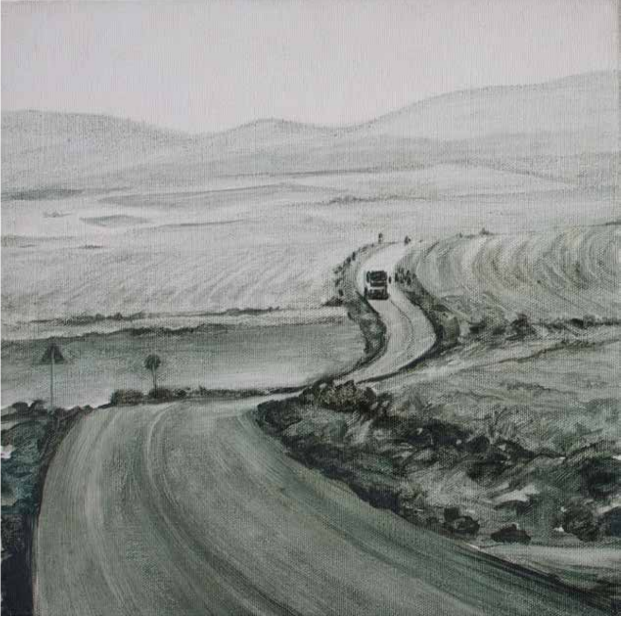
Hakan Özer, Tuval üzerine yağlı boya / Oil on canvas, 30x30cm, 2015