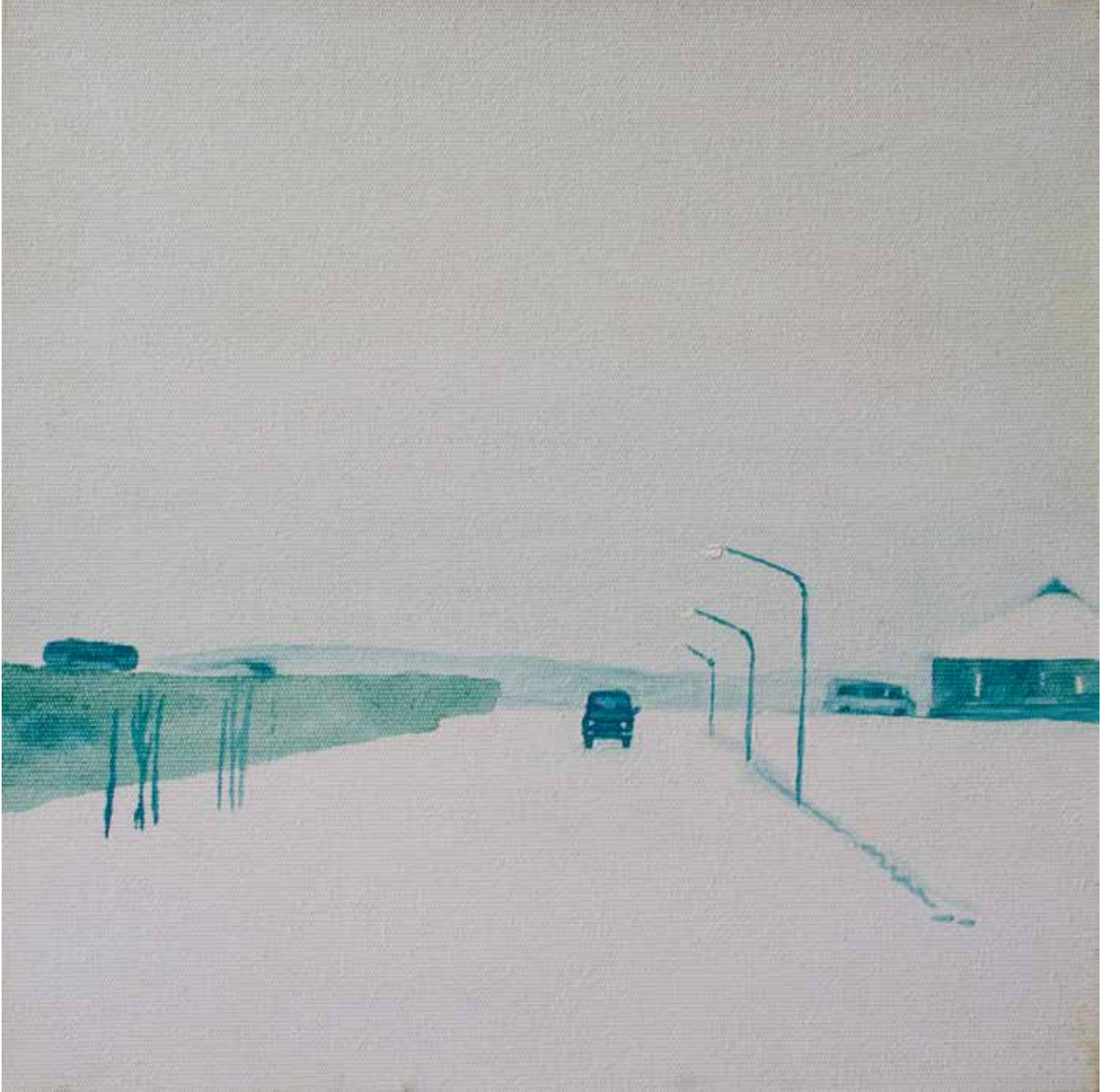
Hakan Özer, Tuval üzerine yağlı boya / Oil on canvas, 30x30cm, 2016