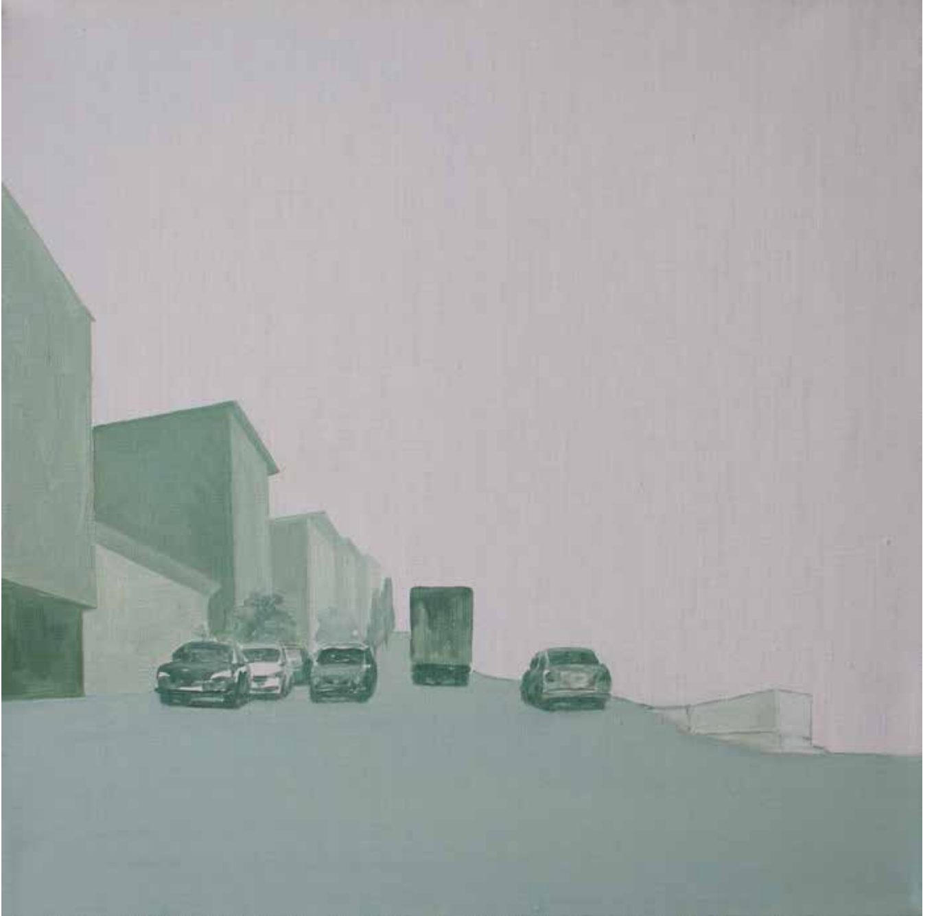
Hakan Özer, Tuval üzerine yağlı boya / Oil on canvas, 40x40cm, 2018