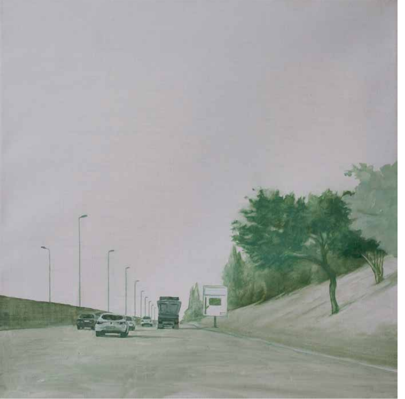
Hakan Özer, Tuval üzerine yağlı boya / Oil on canvas, 40x40cm, 2018