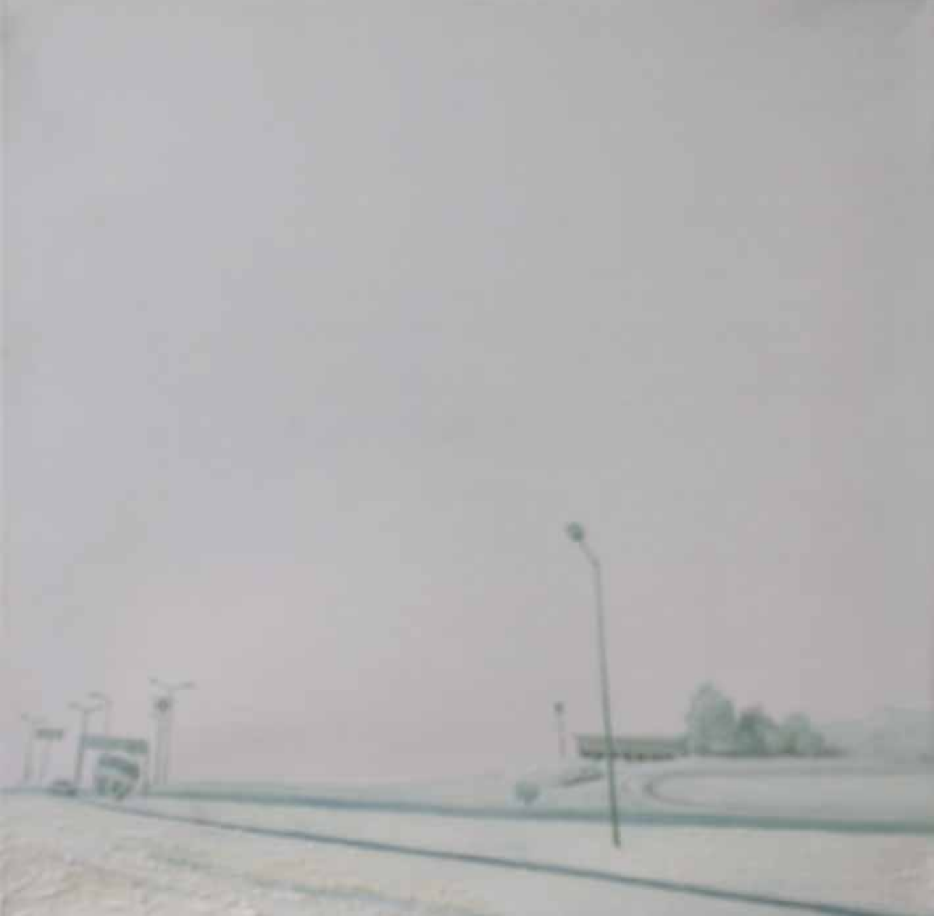
Hakan Özer, Tuval üzerine yağlı boya / Oil on canvas, 40x40cm, 2018