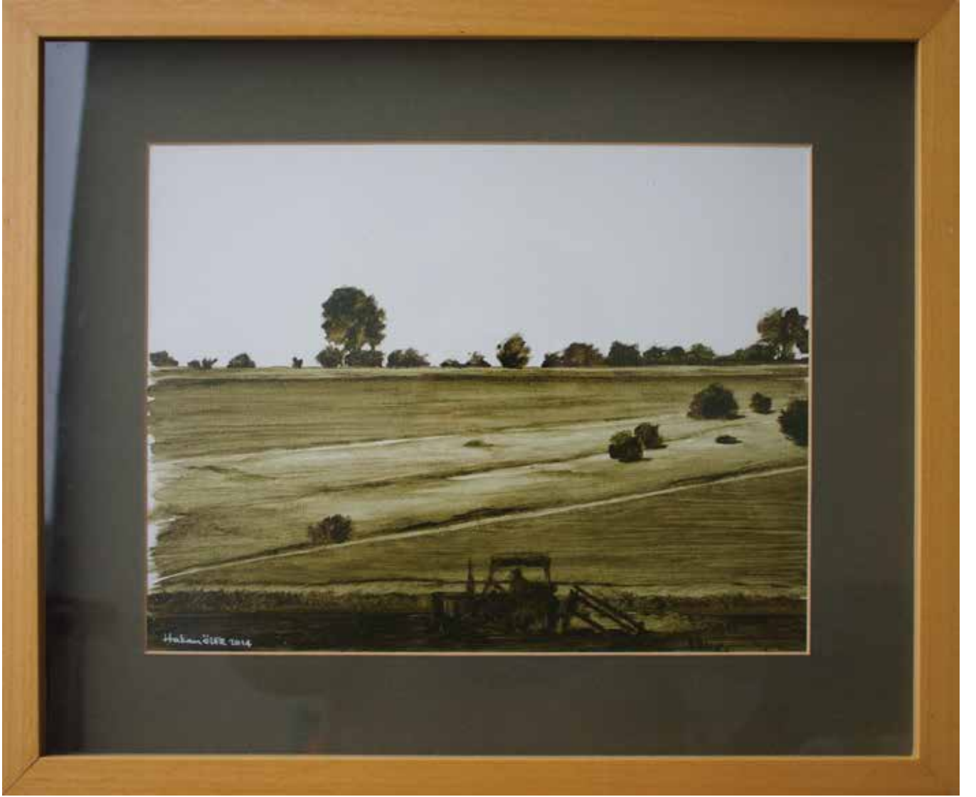
Hakan Özer, Tuval üzerine yağlı boya / Oil on canvas, 38x48cm, 2014