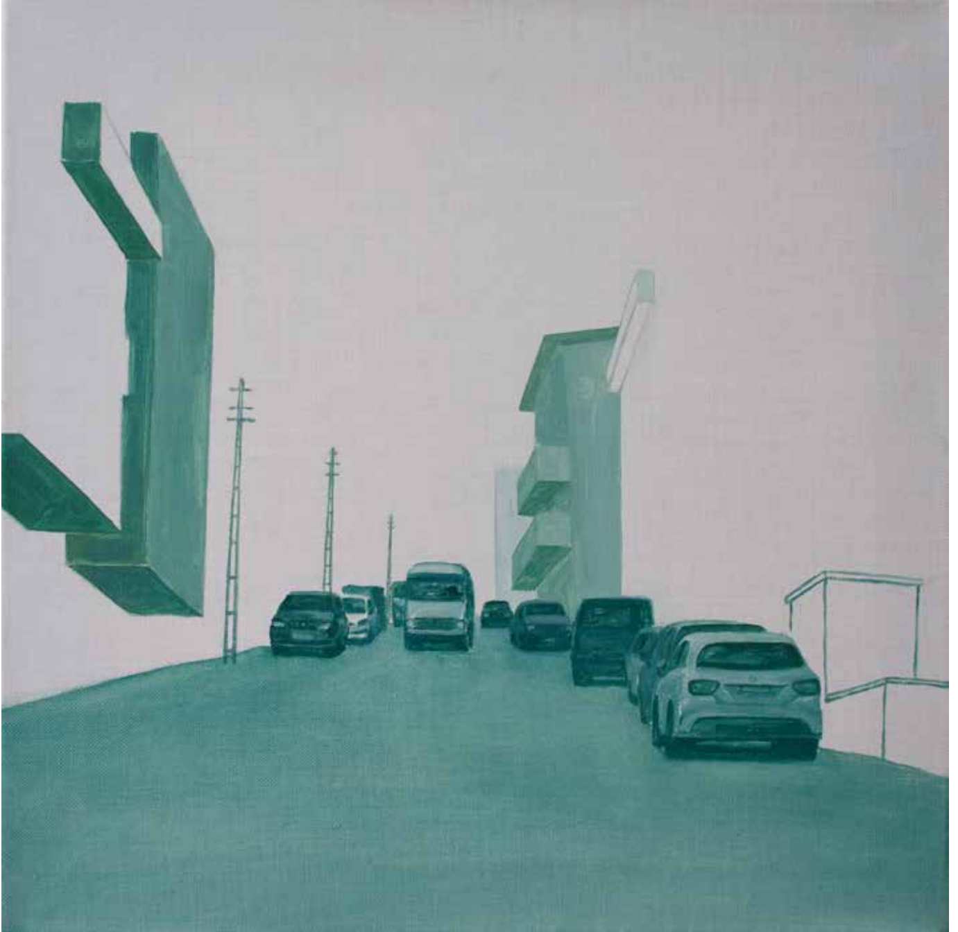
Hakan Özer, Tuval üzerine yağlı boya / Oil on canvas, 40x40cm, 2018