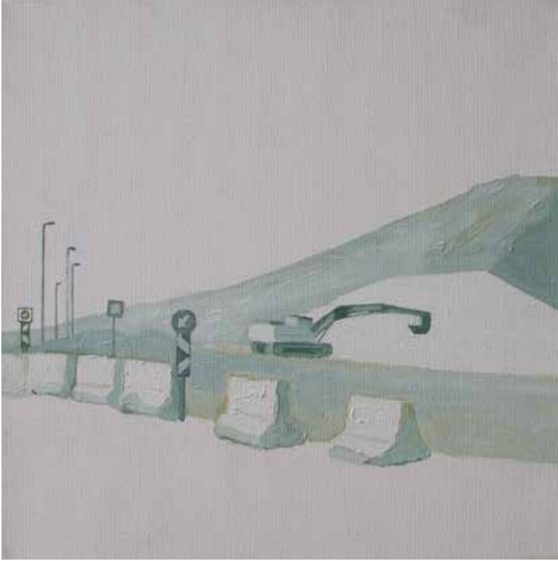
Hakan Özer, Tuval üzerine yağlı boya / Oil on canvas, 30x30cm, 2018