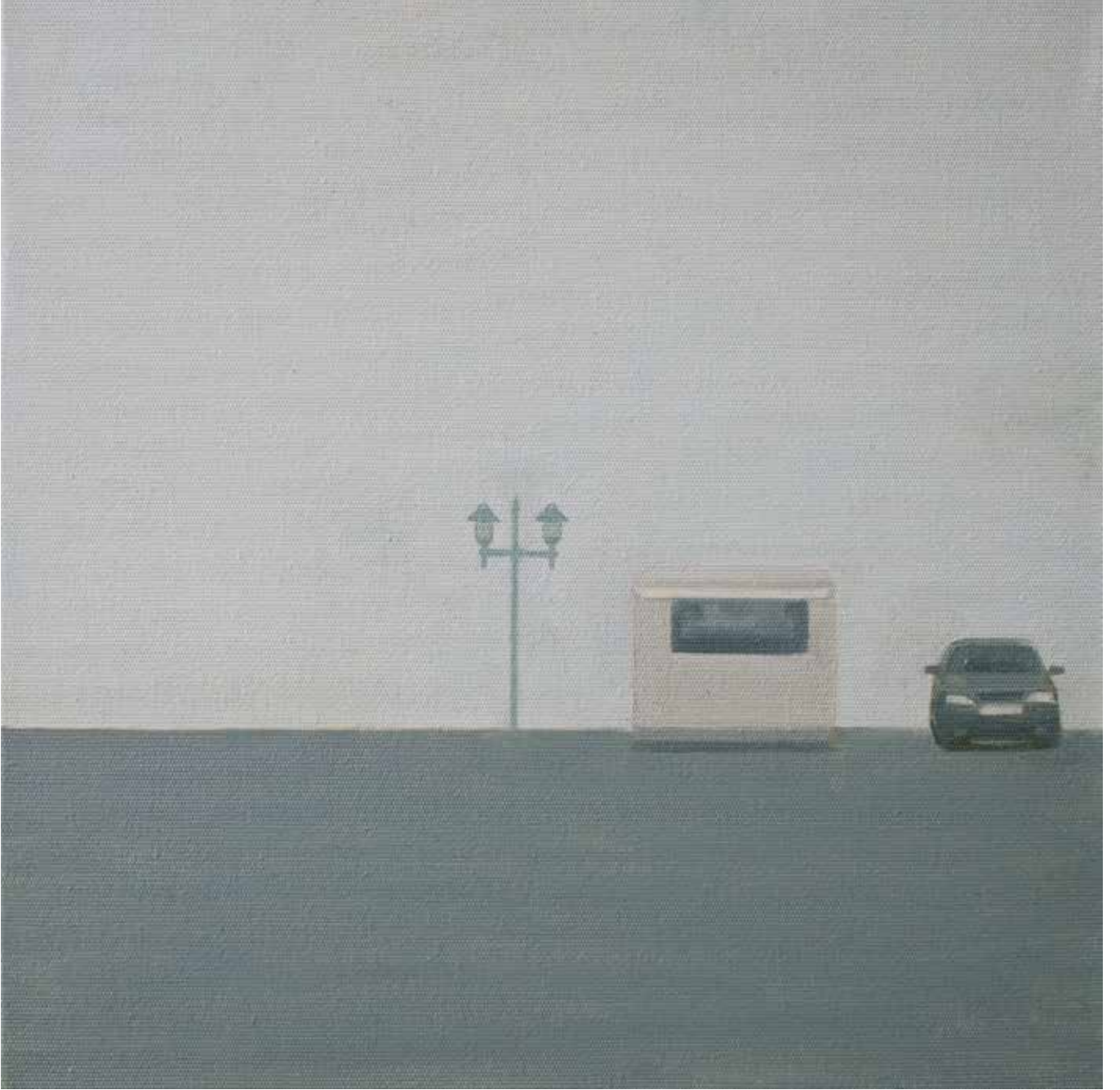
Hakan Özer, Tuval üzerine yağlı boya / Oil on canvas, 30x30cm, 2018