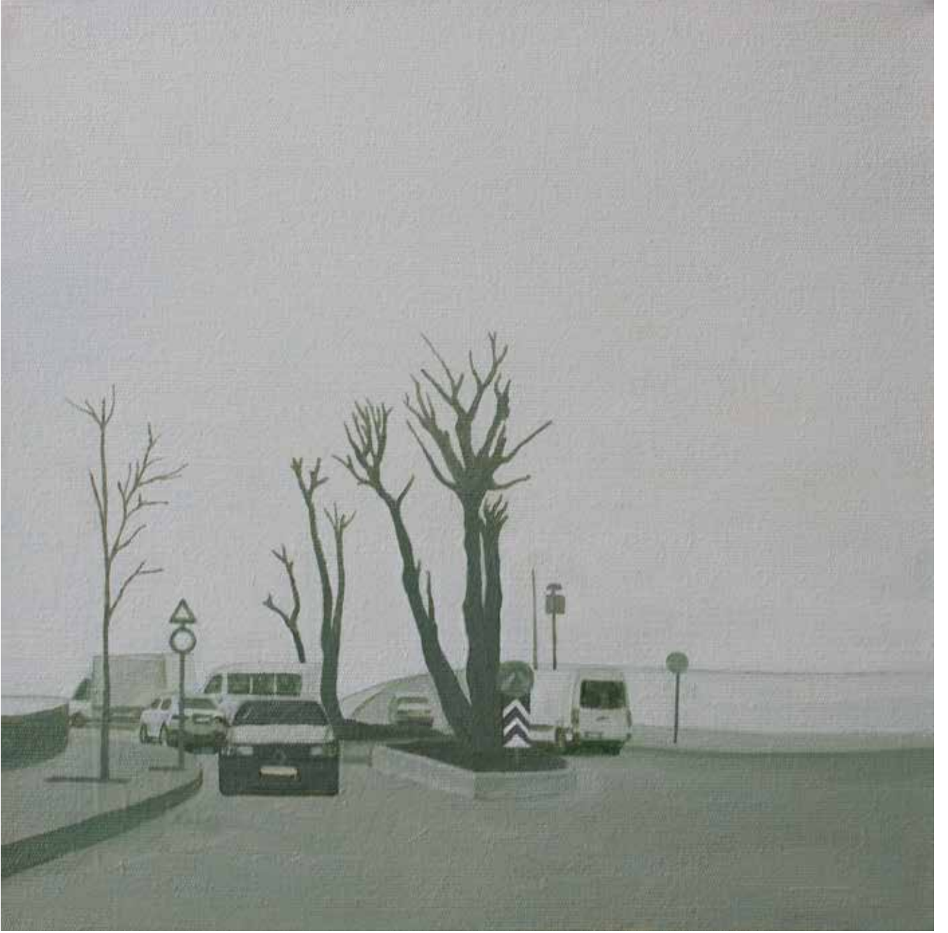
Hakan Özer, Tuval üzerine yağlı boya / Oil on canvas, 30x30cm, 2018