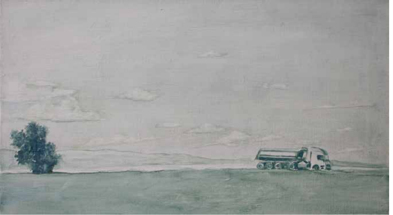
Hakan Özer, Tuval üzerine yağlı boya / Oil on canvas, 20x45cm, 2015