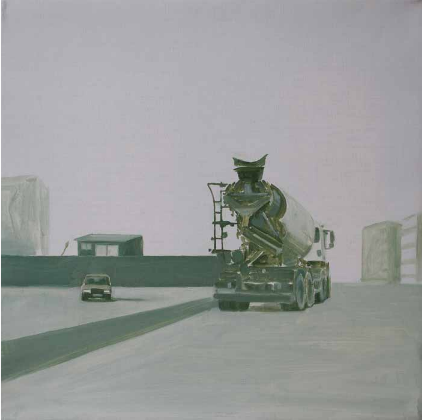
Hakan Özer, Tuval üzerine yağlı boya / Oil on canvas, 40x40cm, 2018