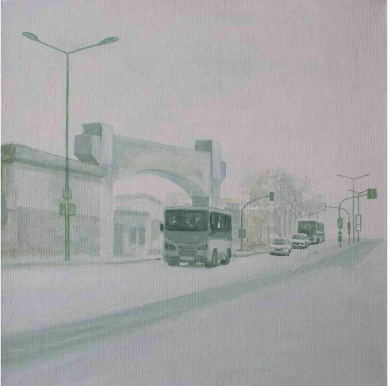
Hakan Özer, Tuval üzerine yağlı boya / Oil on canvas, 30x30cm, 2018