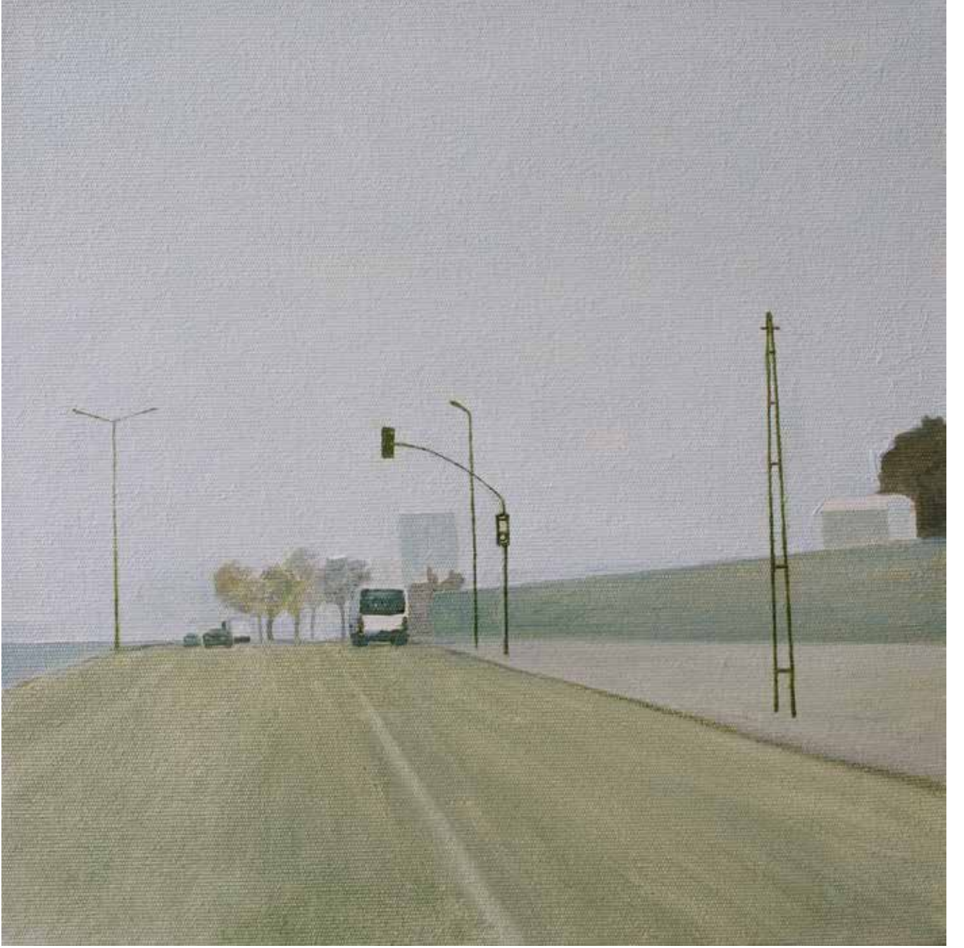
Hakan Özer, Tuval üzerine yağlı boya / Oil on canvas, 30x30cm, 2018