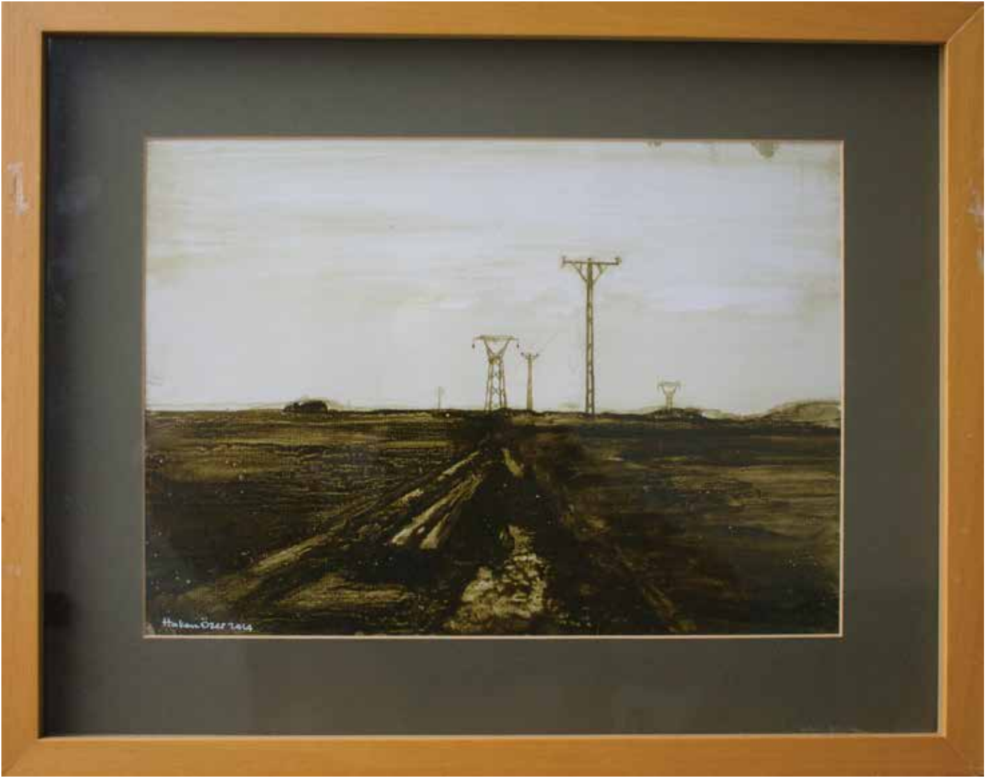
Hakan Özer, Kağıt üzerine yağlı boya / Oil on paper, 38x48cm, 2014