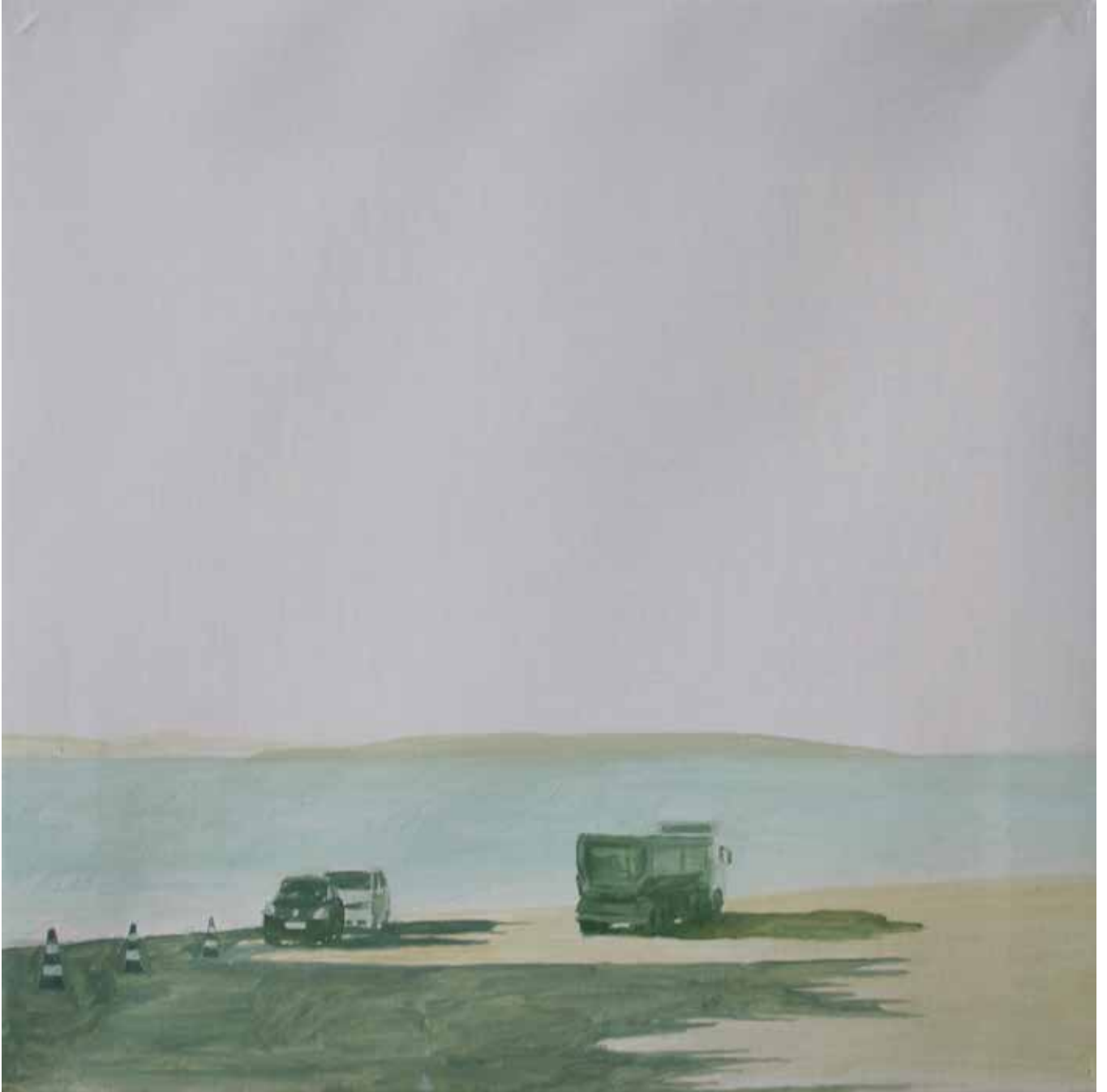
Hakan Özer, Tuval üzerine yağlı boya / Oil on canvas, 40x40cm, 2018