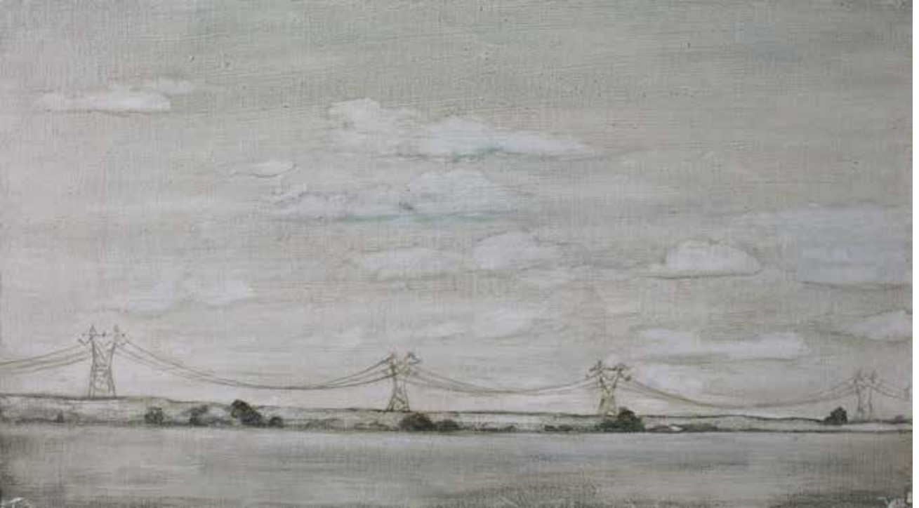
Hakan Özer, Tuval üzerine yağlı boya / Oil on canvas, 20x45cm, 2015