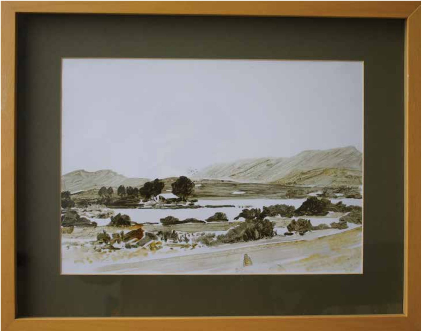
Hakan Özer, Kağıt üzerine yağlı boya / Oil on paper, 38x45cm, 2014