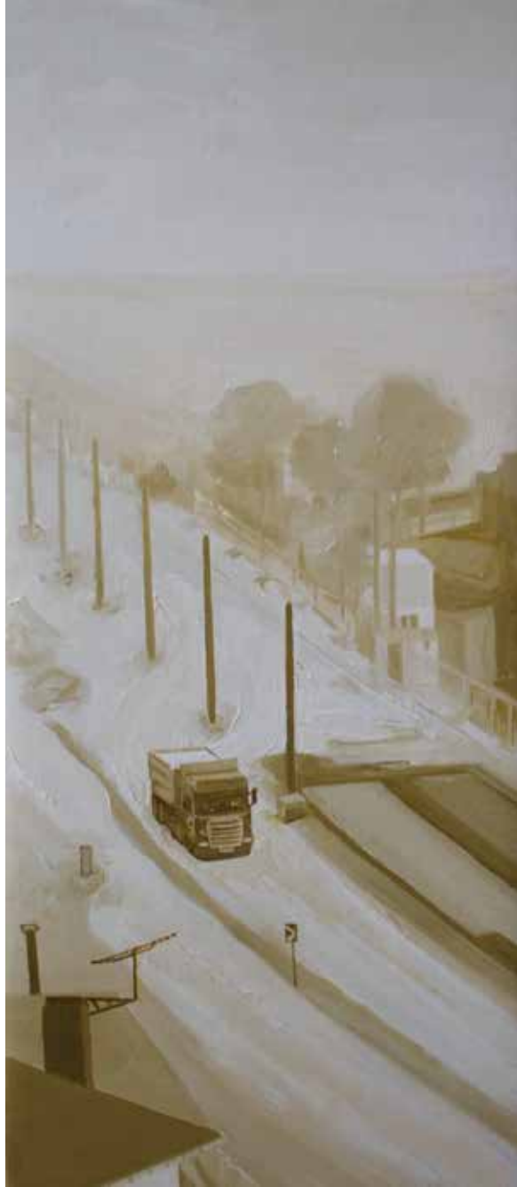
Hakan Özer, Tuval üzerine yağlı boya / Oil on canvas, 20x45cm, 2018