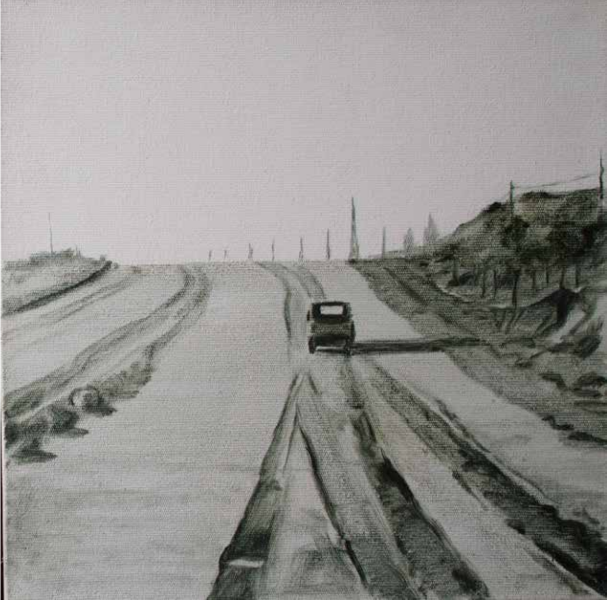
Hakan Özer, Tuval üzerine yağlı boya / Oil on canvas, 30x30cm, 2015