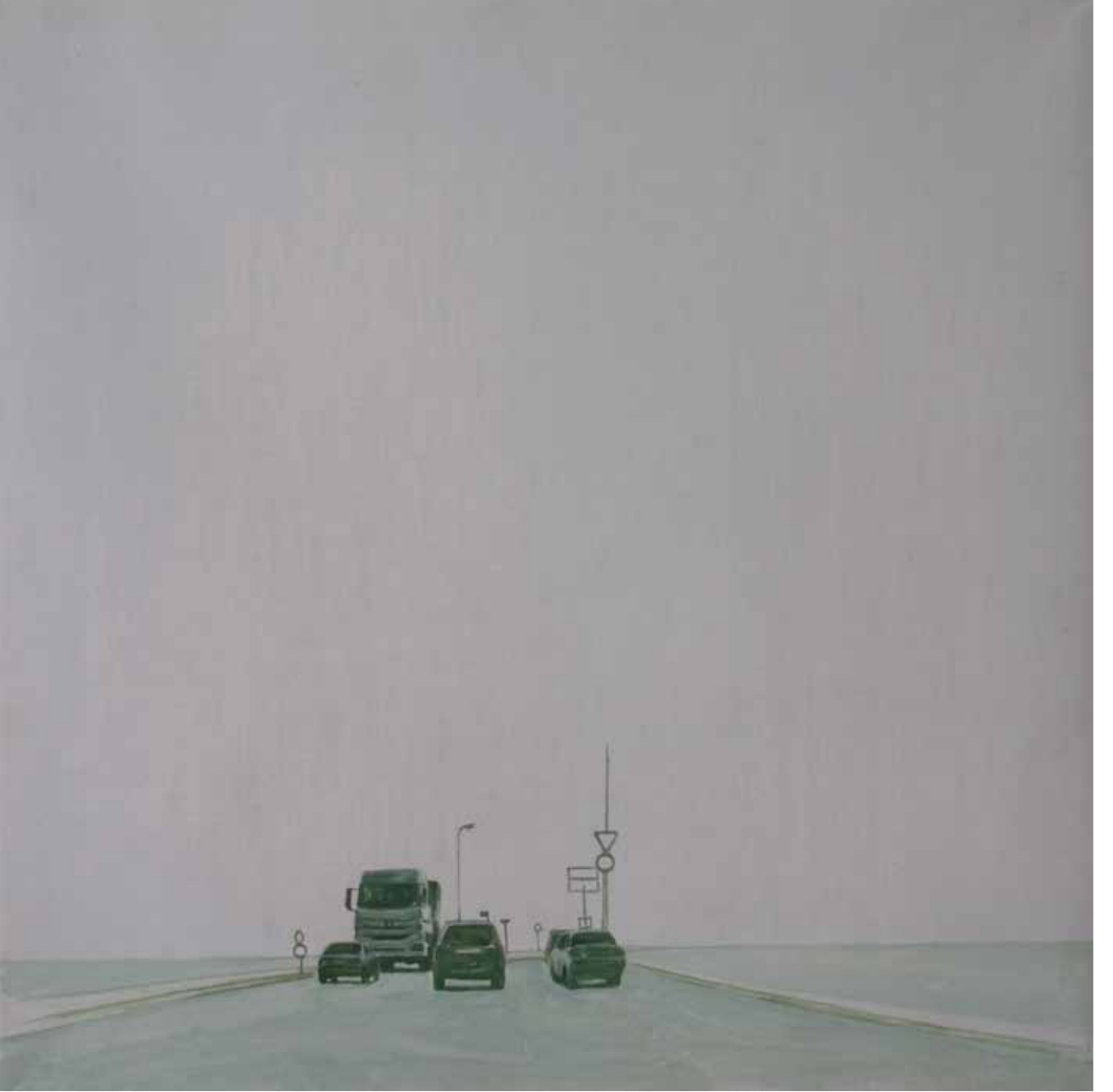
Hakan Özer, Tuval üzerine yağlı boya / Oil on canvas, 40x40cm, 2018